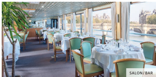
SALON / BAR

Le MS Botticelli comporte deux ponts et 75 cabines , pour nous exceptionnellement 55 doubles et 20 individuelles. 51 cabines en pont principal avec fenêtres non ouvrantes, 24 cabines en pont supérieur avec baies ouvrantes (dont une PMR à grand lit). Le salon bar et le restaurant se trouvent au pont principal.